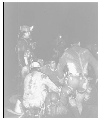
Un exercice secours original et « solidaire »...