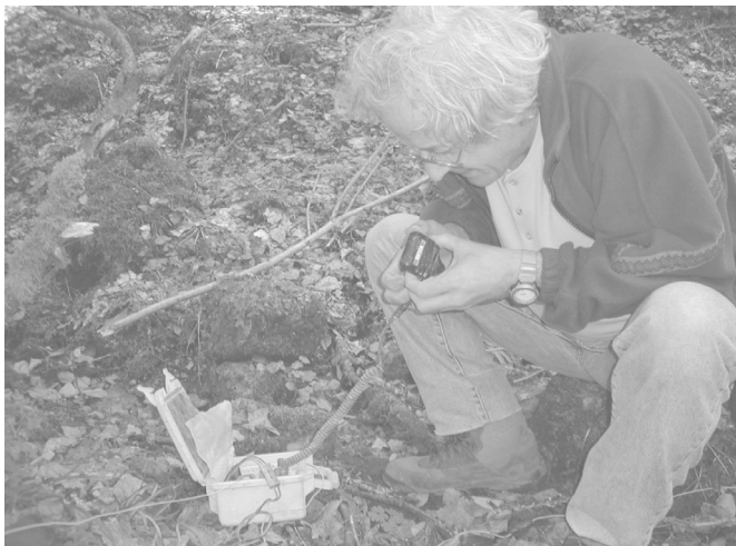
« Alors, le rouge avec le rouge, le noir avec le noir,... »