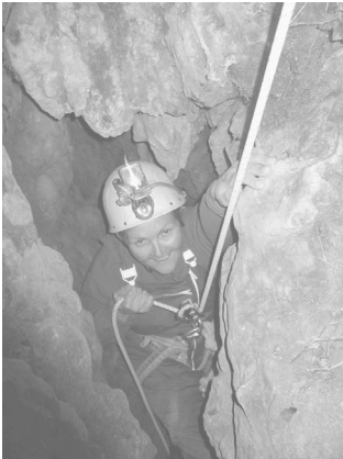
« Très bien, la main droite reste en haut, mais la gauche, elle peut lâcher le rocher. Ca tiens, je te promets... »