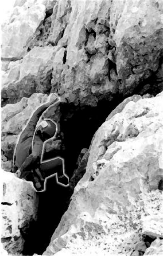
Prospection aux Picos des Europa