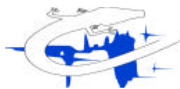
C.N.R.S. Laboratoire Souterrain De Moulis