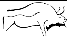
S.M.S.P. Société Méridionale de Spéléologie et de Préhistoire